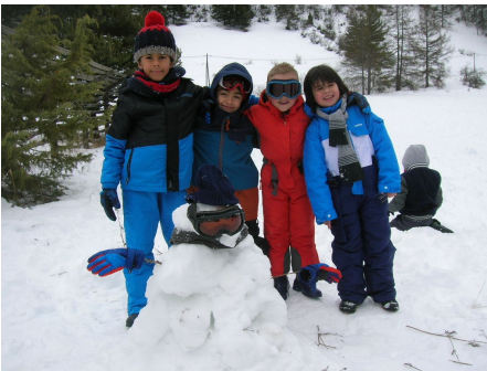
Nous avons fait un énorme bonhomme de neige.