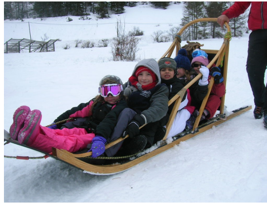
Ce matin nous sommes allés à Meyronnes. C'est tout près de l'Italie. Nous avons tous fait un grand tour en traineaux à chiens.