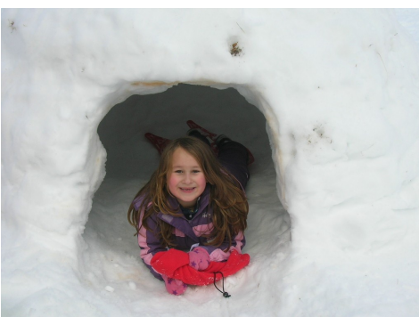
L'igloo est enfin terminé.