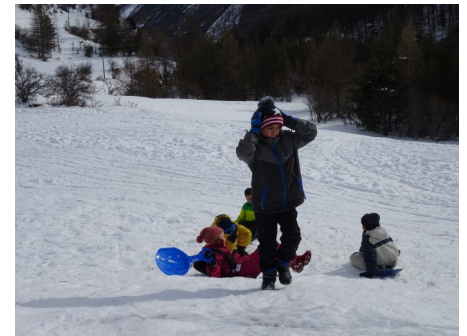
Nous avons fait de la luge dans les champs.