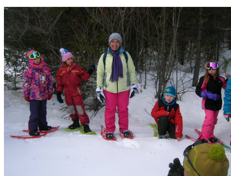
Nous avons fait une balade en forêt. Nous avons joué aux trappeurs et suivi des traces d'animaux... (de cerf, de renard, d'écureuil, de lièvres...)