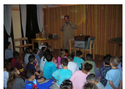
Après le repas un apiculteur est venu nous parler des abeilles.