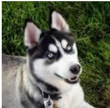
Le husky de Sibérie.