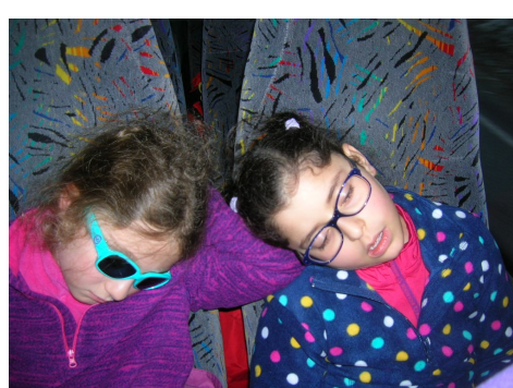
Au retour, certains étaient bien fatigués.