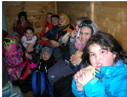
A midi on a mangé des sandwiches dans une cabane en bois...