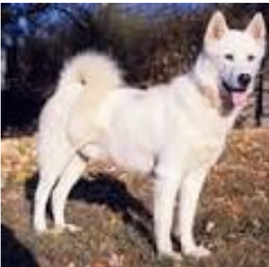
Le chien du Groenland.

Les différentes races de chien de traîneau.