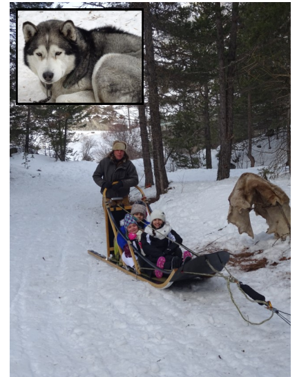
Les chiens sont magnifiques, ce sont des huskys. Ils sont aussi très gentils, on a pu les caresser.