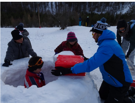
Nous avons fabriqué un igloo comme de vrais esquimaux.