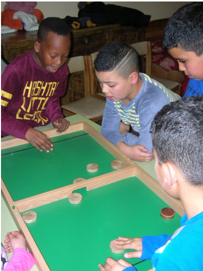
Hier soir, nous avons fait une veillée avec plein de jeux en bois. C'était super...